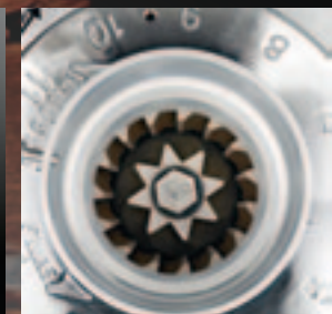
Macine coniche. Conical grinders.