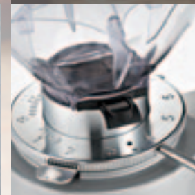
Regolatore macinatura micrometrica. Micrometric grinding adjustment.