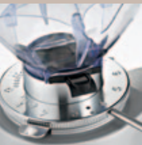
Regolatore macinatura micrometrica. Micrometric grinding adjustment.

Continuous micrometric grinding adjustment Standard varnishing Standard fork Grinding adjustment with ring nut Power: 250 Watt Grinders flat disk of diameter : 58 mm Coffee bean container capacity: 0,6 Kg Net weight: 10 Kg Dimensions: 169x473x240 mm Grinder rev.: 1400/min (50 Hz) 1600/min (60 Hz)