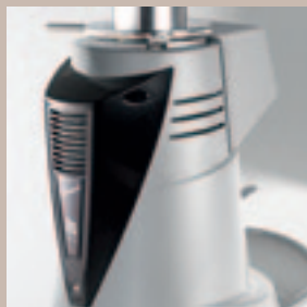
Ventola di raffreddamento automatica. Automatic cooling fan.