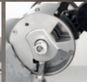
Regolazione dose. Dose adjustment.